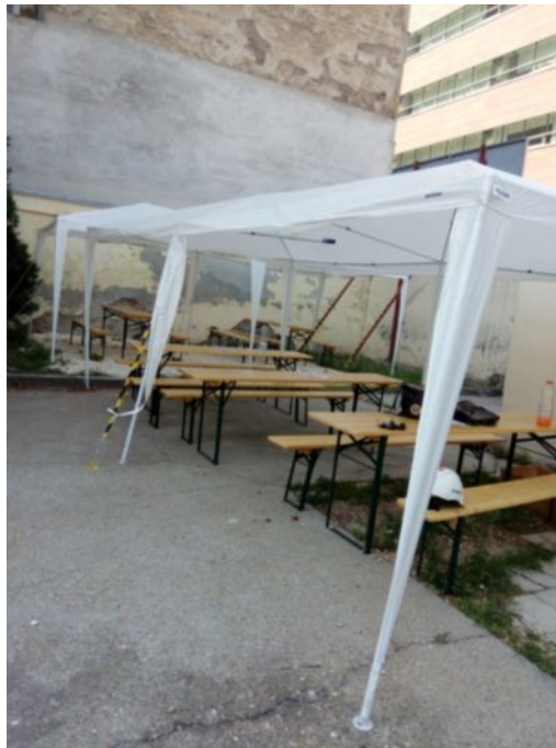
Szabadban felállított étkező/pihenőhely egy építési munkahelyen, amely védi a dolgozókat a napsugárzás káros hatásaitól