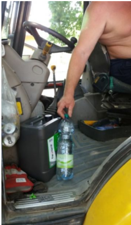
Védőital egy kotró-rakodó földmunkagép gépkezelőjének fülkéjében